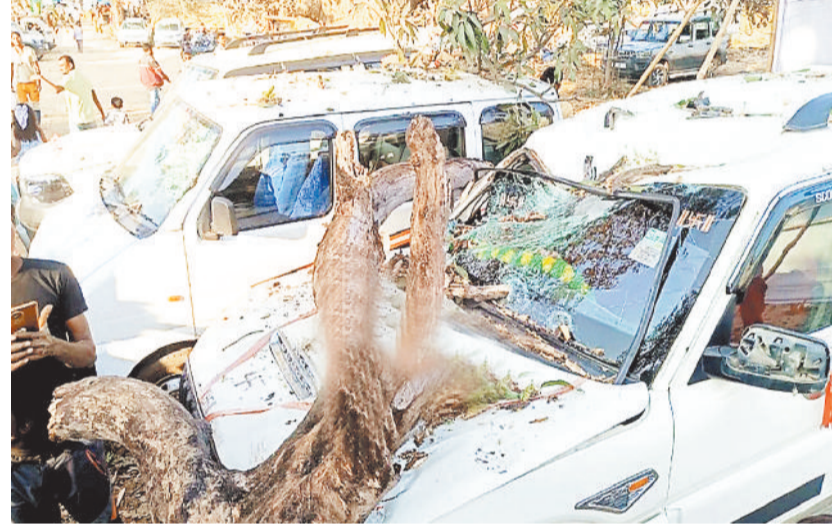
जांजगीर-चांपा। शिवरीनारायण मेला के दौरान पेड़ की टहनी गिरकर कार के ऊपर गिर गई, जिससे 4 कार को नुकसान पहुंचा है। इस दौरान भगदड़ की स्थिति निर्मित हो गई। हालांकि पार्किंग स्थल होने के कारण कोई जनहानि नहीं हुई।