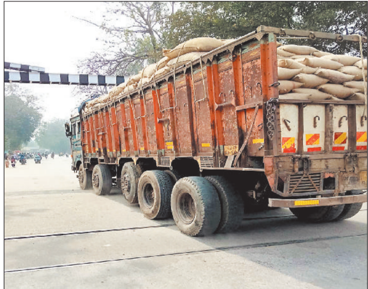
उठा रहता है। यह अधिकांश गाड़ियों में नजर आती है, लेकिन कोई कार्रवाई नहीं होती।

दूसरों के लिए सारे नियम-कायदे, लेकिन खुद के लिए कोई कायदा-कानून नहीं। यह हालात है आरटीओ और ट्रैफिक विभाग का। शहर से लेकर गांवों तक सरकारी धान का परिवहन एक्सल उठे वाहनों में किया जा रहा है। यह गलत है या सही यह तो विभाग जाने, लेकिन इससे सड़कें खराब होती हैं यह तय है। कारण यदि एक एक्सल पूरा उठा हुआ है तो अन्य पहियों पर भार ज्यादा पड़ता है और सड़क खराब होने का कारण बनता है। यह केवल धान परिवहन भर का ही बात नहीं बल्कि प्राइवेट वाहनों में ऐसा नजारा हर पांचवें गाड़ी में नजर आती है। आरटीओ हर चौक-चौराहों पर वाहनों की जांच करते नजर आती हैं, लेकिन ऐसे वाहनों पर उनकी नजर नहीं पड़ती जिसका एक्सल