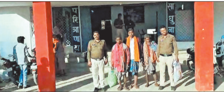
चौक के पास घेराबंदी की। कुछ ही देर में पुलिस टीम ने मुख्य मार्ग पर तीन लोगों को 8