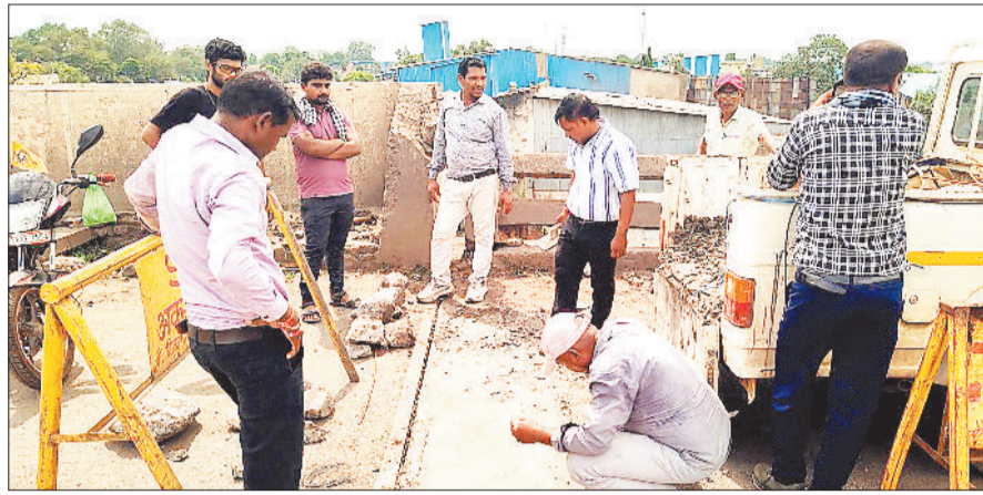
बीच-बीच में इस तरह पेचवर्क कर चलाया जा रहा काम।

अलग तरह के मरम्मत कार्य भी हुए। अब हालात यह है कि पुल पर जगह जगह पर सुराख आने लगा है। भारी वाहनों की लगातार आवाजाही और जर्जर हो चुके पुल पर अब जान का जोखिम मंडराने लगा है। भारी वाहनों के पहिये से पुल पर सुराग होने लगा है। पुल पूरी तरह जर्जर हो चुका है। समय समय पर अलग अलग हिस्सों में काम चलाऊ मरम्मत भी की गई है, लेकिन पुल के पूर्ण मरम्मत की दरकार है। पुल की मरम्मत के लिए पूर्व में विभाग द्वारा शासन को प्रस्ताव भेजा गया था, लेकिन उसे अब तक मंजूरी नहीं मिल सकी है। जर्जर पुल पर आए